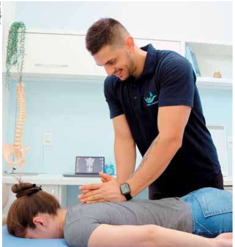
Quiropraxia: cada vez mais difundida e eficaz no tratamento de disfunções musculares e articulares