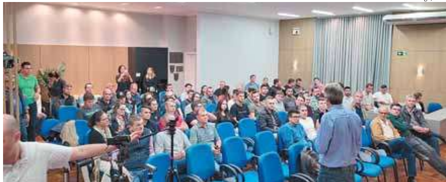
Momento de integração e troca de conhecimento: eventos como palestras técnicas fazem parte do calendário anual da AEAVARP

A Associação dos Engenheiros Agrônomos do Vale do Rio Pardo (AEAVARP) completou 45 anos de atuação em agosto. Inicialmente formada por um grupo de 35 profissionais da área, hoje conta com mais de 120 engenheiros agrônomos da região. Ao longo dos anos, a entidade tem se consolidado como uma das maiores entre as filiadas à Sociedade de Agronomia do Rio Grande do Sul, a Sargs.