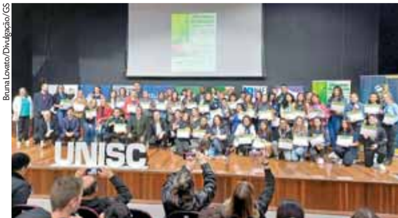
Concurso é direcionado a alunos de escolas públicas ou particulares de dez municípios

Os participantes serão divididos em duas categorias: Categoria 1, com alunos do Ensino Fundamental (7º, 8º e 9º anos) e Categoria 2, com estudantes do Ensino Médio (1ª, 2ª e 3ª anos).