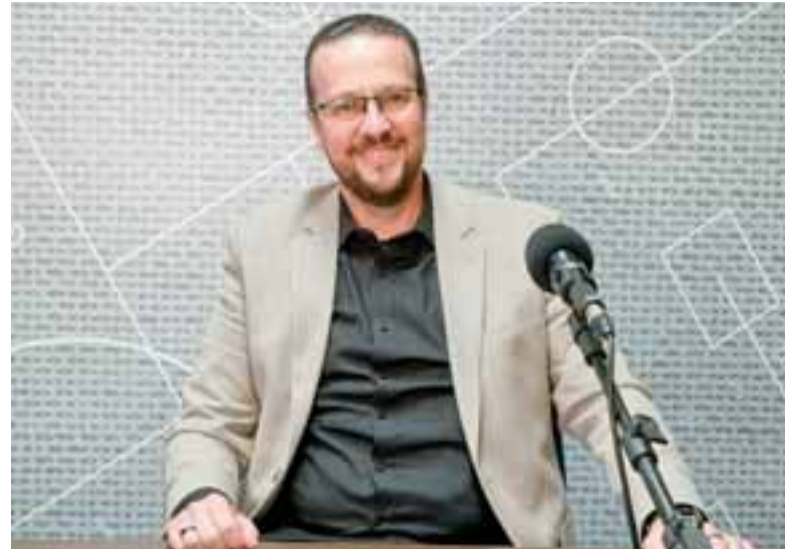
Presidente Fabiano Dupont destacou que o partido organiza uma nominata forte

Entre os sintomas estão aumento da dor, vermelhidão e inchaço na área do ferimento, febre, presença de pus, calafrios e mal-estar. O recomendado é lavar o local, seja com soro fisiológico ou água limpa, mantê-lo coberto com curativo e evitar o contato com água contaminada. Em caso de infecção, é necessário procurar atendimento médico.