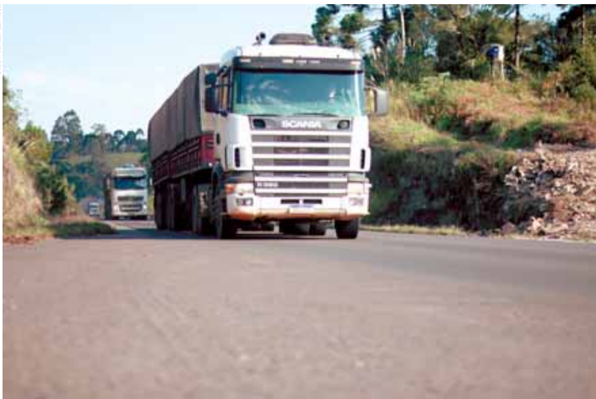
Tráfego de caminhões e carretas diminuiu após a abertura de outras rodovias, como a RSC-287, que foi liberada nos últimos dias

Os velhos problemas, contudo, continuam existindo. A sinalização – tanto vertical como