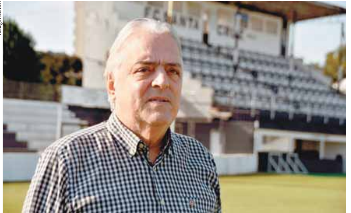
Tabajara conta com a experiência de já ter comandado o clube carijó e diz que conselheiros o procuraram para concorrer ao pleito

Tabajara disse que conselheiros o procuraram para registrar uma chapa no pleito desta noite. “Me inscrevi oficialmente. Pro-