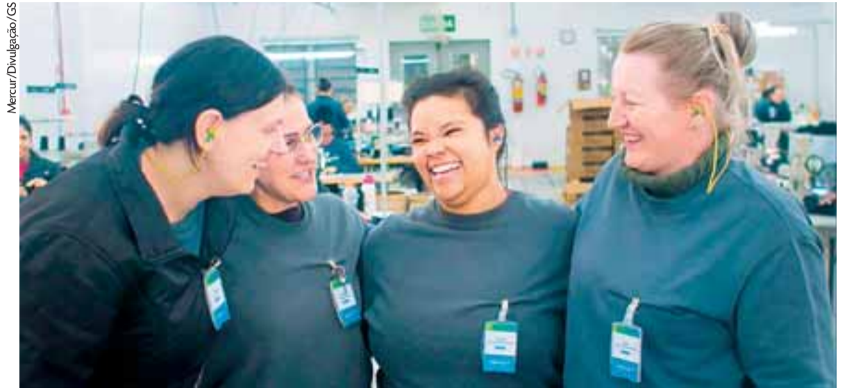
Com uma história de tradição e desenvolvimento, empresa santa-cruzense é conhecida pela atenção que dedica às suas equipes

“Neste momento tão desafiador para nossa comunidade, é importante mantermos a criatividade aguçada. Nada melhor que um ambiente fértil para is-