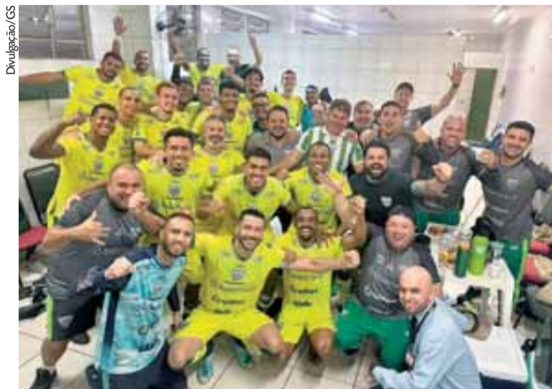
No vestiário, Periquito comemorou a vitória diante do Concórdia, em Santa Catarina

O casal que tirar uma foto no jogo e marcar o perfil do Avenida no Instagram vai concorrer a duas camisetas oficiais. Os ingressos podem ser adquiridos na secretaria do clube, no site ecavenida.ingressos.com.br ou na Ulfer Purificadores, além da bilheteria, antes da partida. Com quatro pontos, o Avenida é sétimo