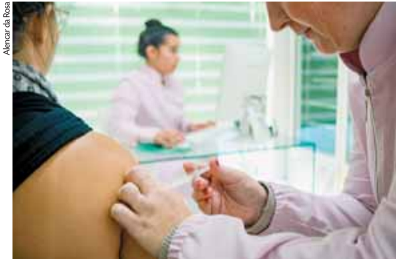
Imunizantes ajudam a evitar enfermidades que podem ser contraídas em alagamentos

A recomendação foi feita em documento conjunto da Sociedade Brasileira de Infectologia (SBI), Sociedade Gaúcha de Infectologia (SGI) e Sociedade Brasileira de Imunizações (SBIIm). Na nota, os especialistas priorizaram a vacinação em desalojados, abrigados, voluntários de abrigos, socorristas, médicos, veterinários e grupos prioritários, como crianças, idosos e gestantes.