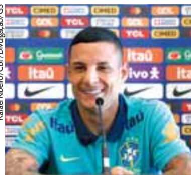
Arana espera brilhar com a amarelinha

“Temos um grupo jovem, contra o México começamos bem. Depois, pela falta de entrosamento, o clima quente, caímos,