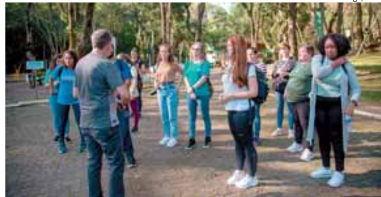
Atividade de campo nessa segunda-feira levou professores de Biologia até a área verde

Depois de uma de suas sessões de furtos, Osamu e seu filho se deparam com uma garotinha. A princípio, eles relutam em abrigá-la, mas a esposa de Osamu concorda em cuidar dela após saber das dificuldades que a jovem enfrenta. Embora a família mal ganhe dinheiro com os pequenos crimes que comete, todos parecem viver felizes, até que um incidente revela segredos escondidos. A obra obteve a Palma de Ouro em Cannes em 2018.