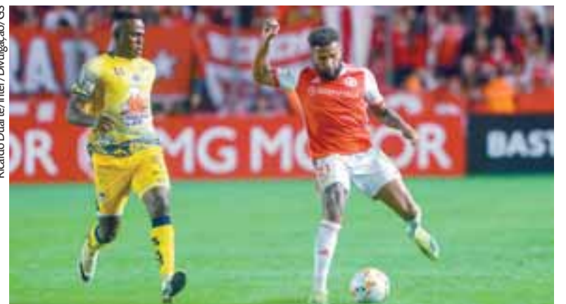
No sábado, Colorado avançou na Sul-Americana depois de vencer o Delfín por 1 a 0