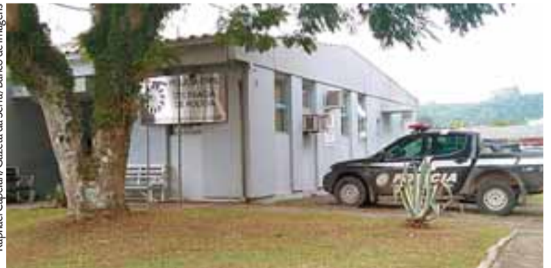
O caso foi registrado pela BM na delegacia e está sendo investigado pela Polícia Civil