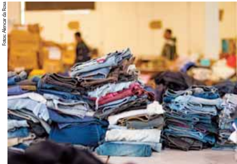
Calças e casacos sem condição de uso ganham novo destino nas mãos das costureiras

As peças em mau estado de conservação foram encaminhadas para descarte na usina da Conesul, que faz a coleta de resíduos sólidos urbanos. “A equipe responsável fará a triagem e destina-