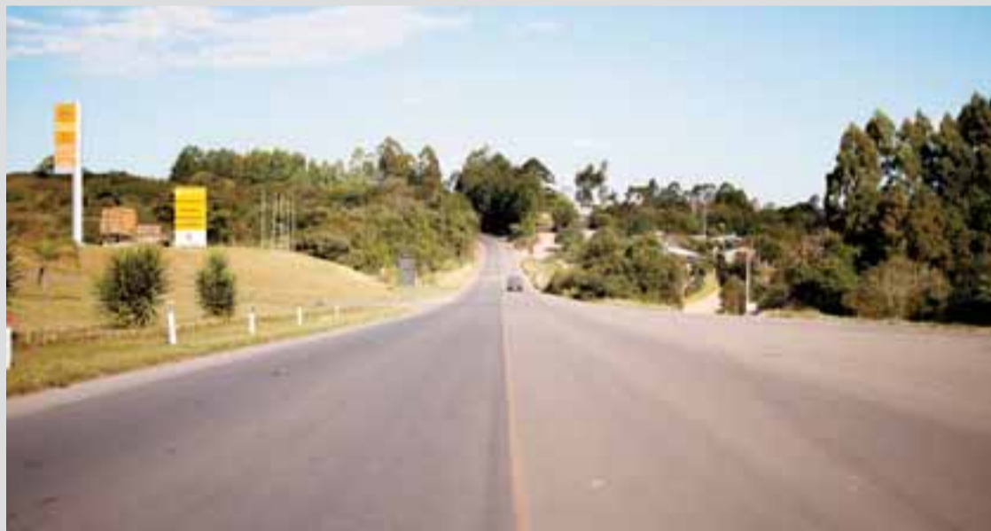
Alguns trechos receberam nova camada de asfalto, mas ainda é necessário melhorar sinalização com demarcações de pista

al, os condutores não enfrentam grandes riscos ao trafegar pela RSC-153 durante o dia. À noite, a viagem continua não recomendada.