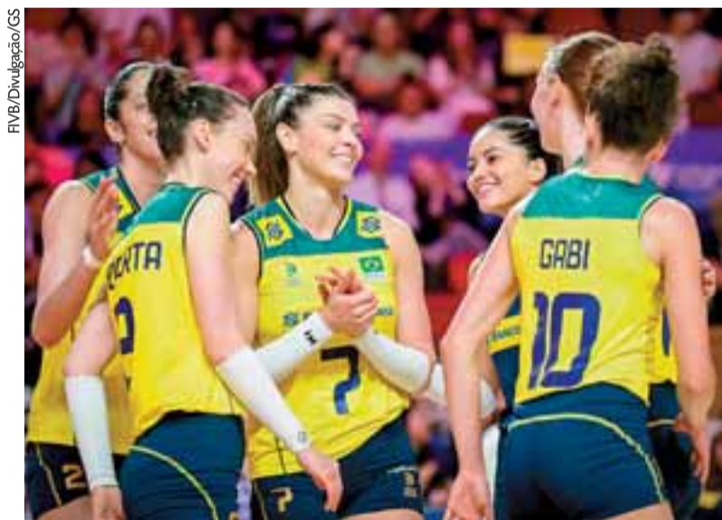
Equipe nacional bateu as alemãs por 3 sets a 1 e alcançou a décima vitória consecutiva

Com uma equipe mista, entre titulares e reservas, o Brasil enfrentou dificuldades no ataque