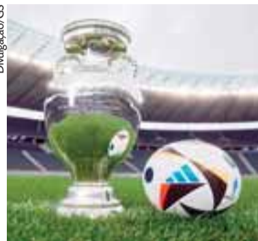
Torneio terá a participação de 24 clubes