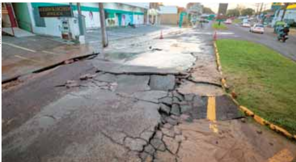
Asfalto ficou bastante danificado e água avançou pelo quarteirão. Trabalhos de reparos ocorreram à noite