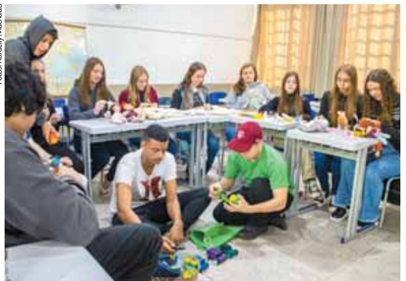
Alunos produziram brinquedos que serão entregues a famílias atingidas por enchente

A docente analisa que o projeto foi muito importante para os alunos, assim como será para as crianças que receberão os brinquedos. “Durante a montagem, alguns pareciam estar brincando na infância. A atividade trouxe memórias boas para eles”, comenta. Além de realizar a entrega das peças, os estudantes farão