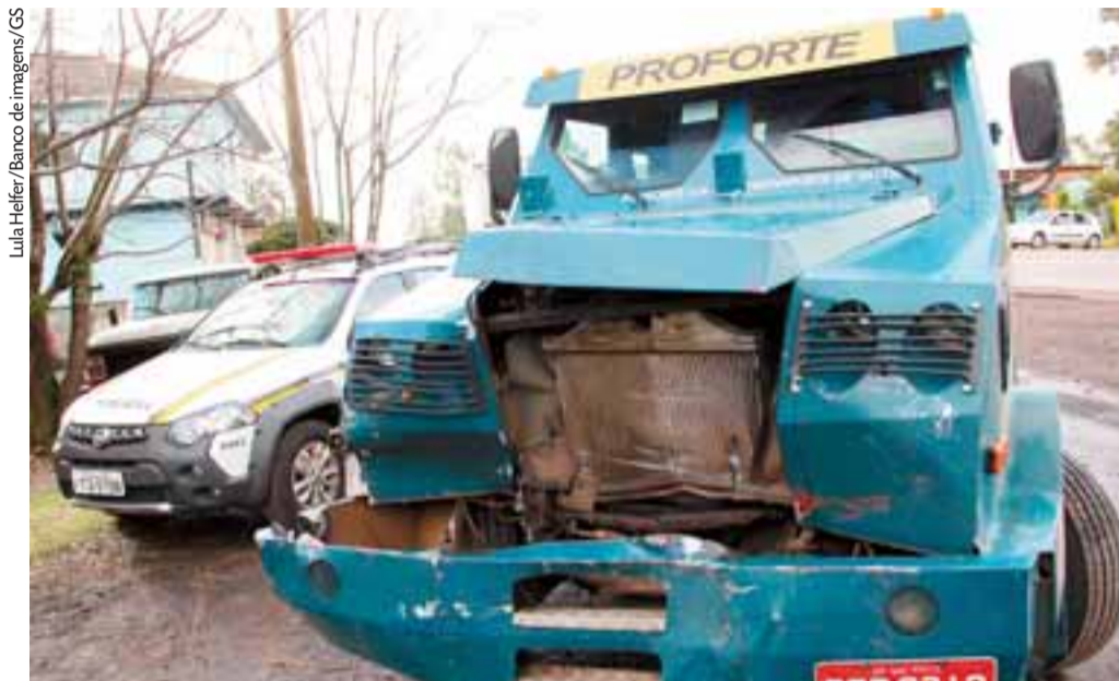
Com manobras evasivas em meio ao ataque dos bandidos, motorista seguiu caminho na direção de Passa Sete

Foi em uma manhã como esta de sexta-feira, há dez anos, que transcorreu aquele que é considerado o maior confronto entre criminosos e a polícia na história da região. Naquele dia, 6 de junho de 2014, Carlos Ivan Fischer, o Teco, e seu bando tentaram roubar um carro-forte e chegaram a jogar um caminhão contra o blindado nas proximidades da Curva das Cobras, em Sobradinho, na ERS-400. O que os bandidos não imaginavam é que a hoje extinta Delegacia Especializada de Furtos, Roubos, Entorpecentes e Capturas (Defrec) de Santa Cruz do Sul sabia do plano. Surgindo em meio aos matagais, cerca de 50 agentes fecharam o cerco. A troca de tiros foi inevitável, e o caso surpreendeu o Estado, principalmente porque Teco acabou morrendo no confronto, dando fim a uma trajetória marcada por crimes. Motorista do carro-forte, uma jovem precisou mostrar perícia no volante ao ser abordada em meio às curvas da rodovia sinuosa com um ataque suicida do quadrilheiro e rajadas de disparos de arma longa. Dez anos depois, a Gazeta do Sul localizou a motorista e irá contar, na 11ª reportagem da série Casos do Arquivo , o episódio sob a ótica dessa mulher que participou diretamente da ocorrência.