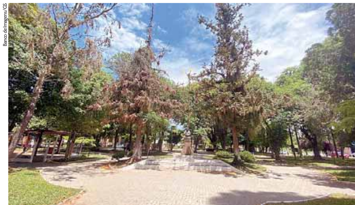
Obra em fase de licitação está prevista para a Praça Protásio Alves, localizada em frente à Igreja Nossa Senhora do Rosário

Também alegou que o certame é todo por meios eletrônicos, cujo acesso ainda está inviabilizado a percentual muito alto de interessados devido ao desastre climático no Estado, mantendo-se a falta de conexão pela internet. O orçamento inicial para construir o coreto soma R$ 107.593,33.