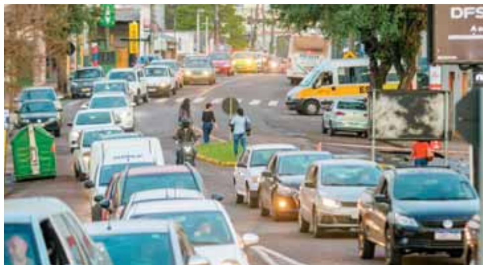
Com o bloqueio, fluxo de automóveis precisou ser direcionado para outras ruas. Houve congestionamento