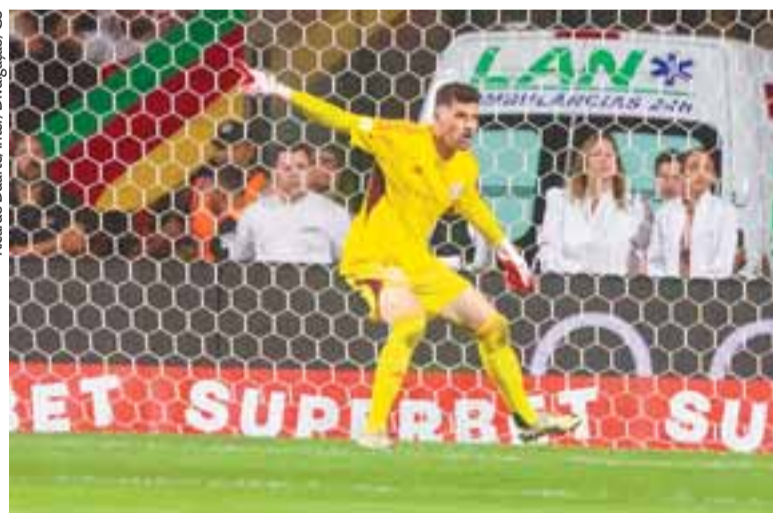
Goleiro colorado salvou o time, que mostrou pouco futebol diante do Tricolor paulista

A pasmeira se repetiu até os primeiros minutos do segundo tempo, quando o São Paulo acordou. A equipe de Zubeldía