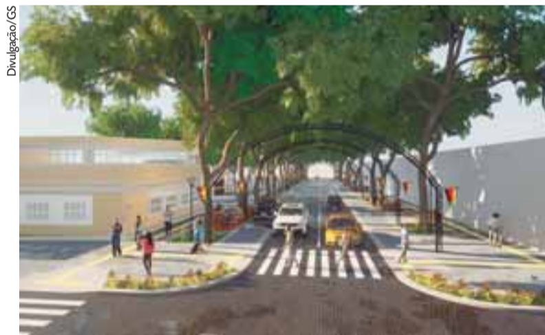
Projeto visa seguir com o plano de revitalização como ocorreu nas quadras seguintes

nal de Contas do Estado. O objetivo é realizar intervenções semelhantes às ocorridas no trecho do calçadão da Floriano em que já houve a revitalização, nas qua-