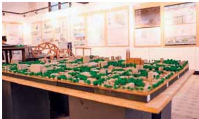
Público poderá conferir maquetes elaboradas por alunos concluintes do curso da Unisc