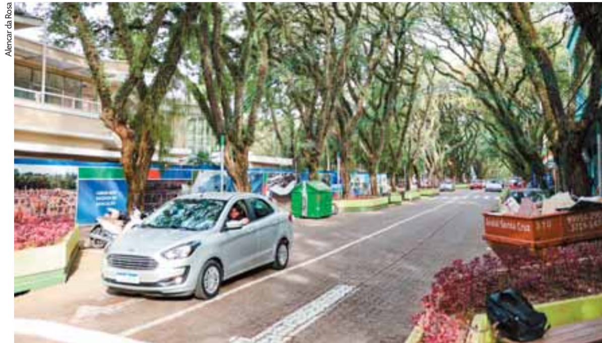
Obra avançaria em direção à Ramiro Barcelos, completando o projeto que foi desenvolvido entre a 28 de Setembro e Tiradentes

A intenção da Prefeitura é promover ajustes no projeto e encaminhar novamente para licitação, dentro das orientações do Tribu-