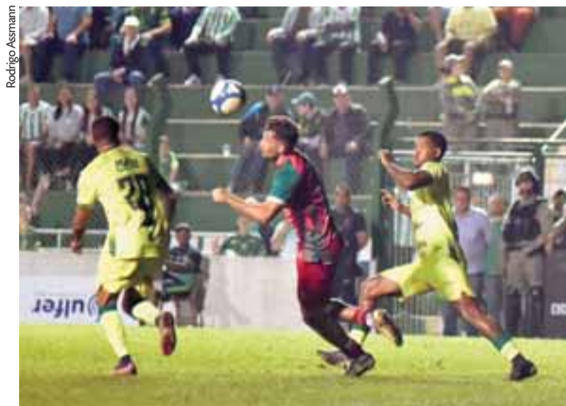
Periquito superou o Concórdia por 1 a 0 na noite da última quarta-feira, nos Eucaliptos

Campos valorizou as condições do grupo e o empenho da cada jogador. “O grupo é curto,