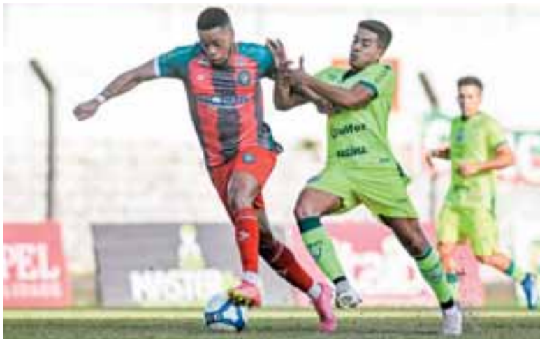
Avenida encarou o líder Concórdia na casa do adversário e saiu com a vitória sábado

O Avenida teve um gol de Carlos Alberto anulado por impedimento aos 8 minutos, e o Concórdia saiu na frente aos 13. Lustosa cobrou falta da esquerda, e Alison Mira subiu para cabecear