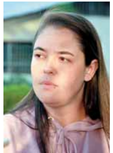
Francine: limpeza e ampliação de bueiros