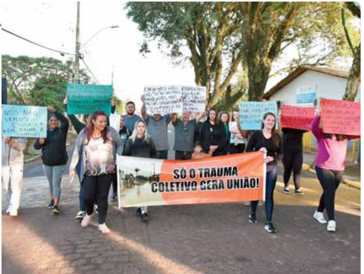
Solução imediata: alguns dos moradores do Bairro Várzea exigem medidas urgentes para evitar prejuízos com novas enchentes