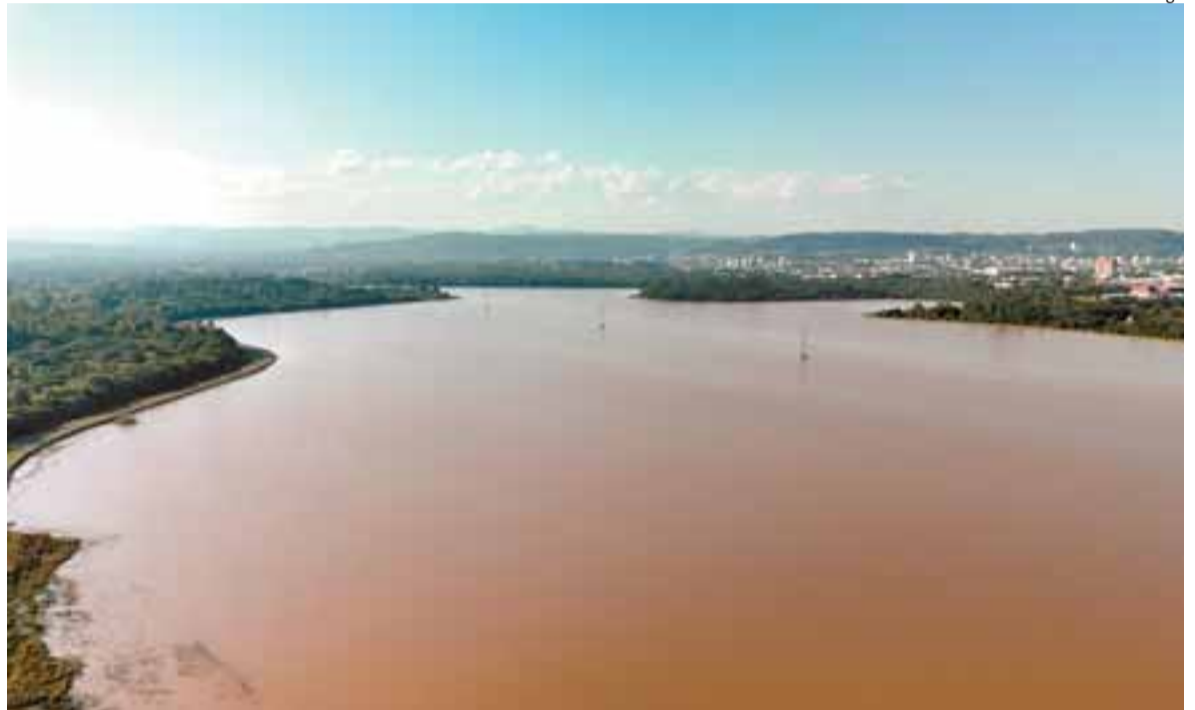
Turbidez da água no Lago Prefeito Telmo Kirst é resultado da areia, barro e outros resíduos carregados pela forte enxurrada