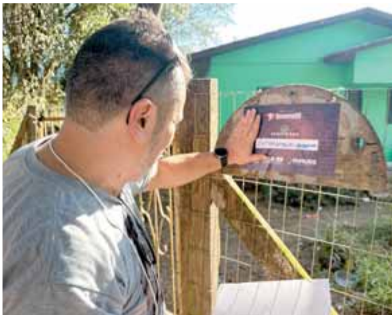
Por causa da situação agravada pelas enchentes de maio, 17 residências e duas pontes tiveram laudos com indicação de interdição a partir das análises feitas pelos voluntários