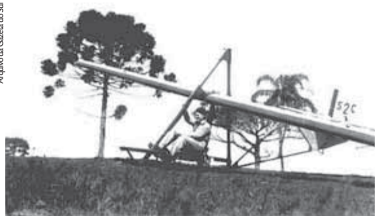
Planador SC-2 foi construído em 1939, com a orientação de técnicos da Varig