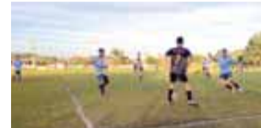
Bola rolou no Estádio da Serraria ontem

Um belo domingo de sol e calor abrilhantou a rodada de abertura da Copa CFC Celso/Taça 200 Anos de Imigração Alemã, campeonato sub-18 da Liga de Integração do Futebol Amador de Santa Cruz do Sul (Lifasc). No Estádio da Serraria, em Monte Alverne, o atual campeão, São José, foi o anfitrião da rodada.