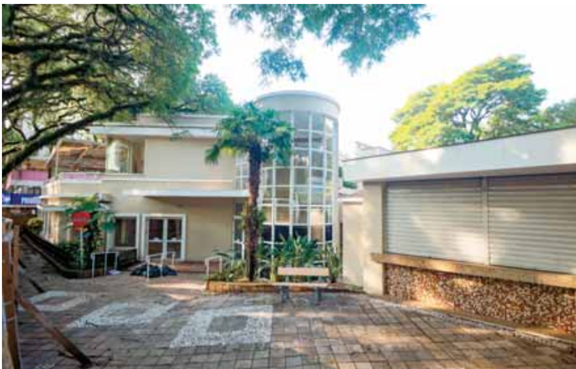
Fechado há mais de dois anos, previsão é de que o empreendimento volte a operar em breve no tradicional ponto de Santa Cruz

tem sido constante com a Prefeitura para acompanhar a evolução do processo. O projeto das adequações que precisarão ser feitas também está pronto. Enquanto aguarda, está conduzindo a encomenda e montagem do bufê, balcões, cadeiras e outros itens necessários. “Estamos aguardando com tranquilidade, já que temos o ponto atual e estamos operando”, afirma.