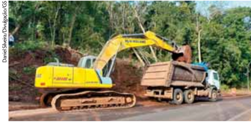
Trabalho das equipes e máquinas começou na manhã de sábado, no Acesso Grasel