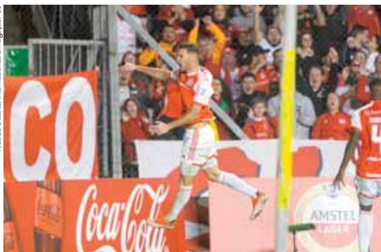
Alario apareceu para concluir e garantir classificação colorada na Copa Sul-Americana

saiu muito irritado com um torcedor que o ofendia. Ele não gostou do cruzamento com o clube em que foi jogador e treinador entre 2015 e 2017. “Era o único lugar onde eu não queria ir. Encontrarei um clube que amo, minha gente. Sempre é difícil enfrentá-los. Seguramente vão ser duas partidas com um clima espetacular, como se fossem duas finais”, declarou.