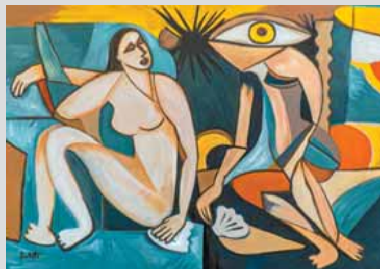
Obras representam um mergulho nas origens do lado instintivo do ser humano