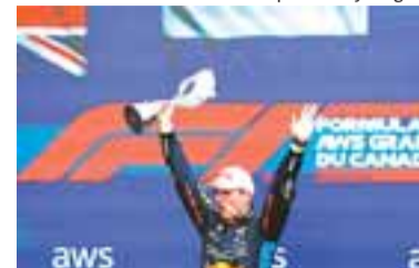
Max Verstappen voltou a triunfar na F1

Max Verstappen (Red Bull) venceu o GP do Canadá disputado ontem no circuito Gilles Villeneuve, em Montreal, e recebeu um troféu com design criado por inteligência artificial, em parceria da Fórmula 1 com a Amazon. Lando Norris (McLaren) e George Russell (Mercedes) fecharam o pódio. Lewis Hamilton, que ficou com a volta mais rápida, chegou a ultrapassar o companheiro de equipe nas últimas voltas, mas acabou na quarta colocação.