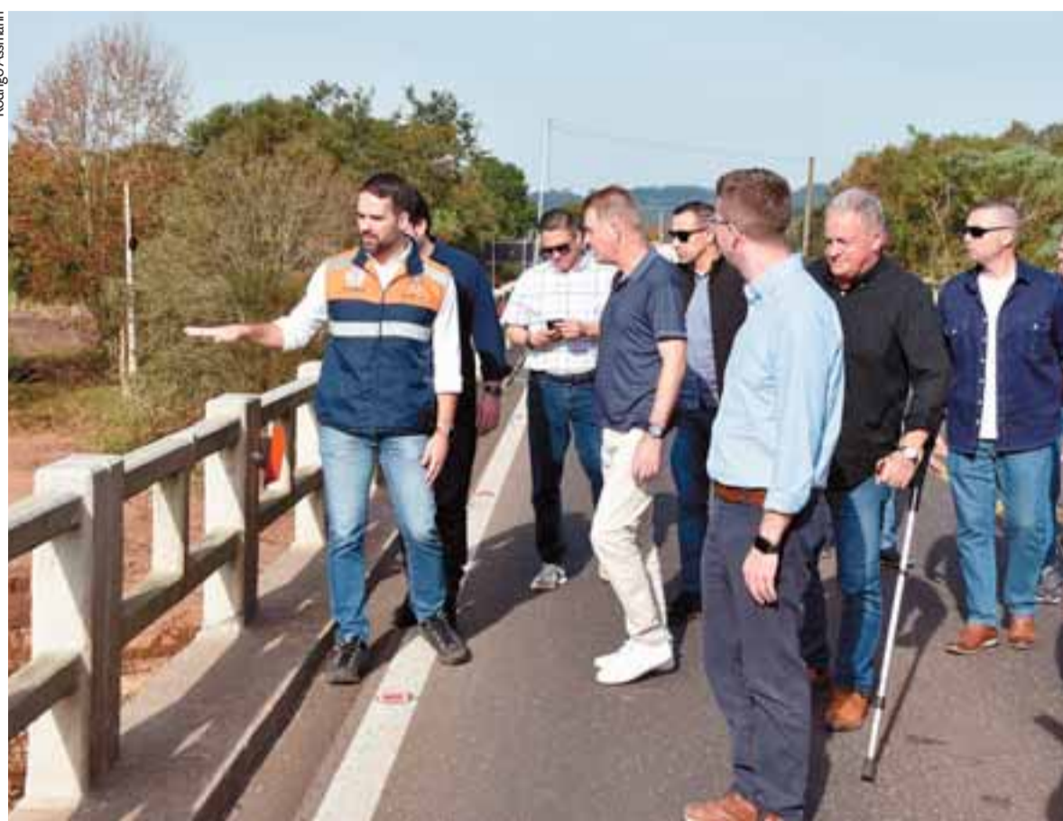
Acompanhado de integrantes da Rota de Santa Maria e do prefeito de Candelária, governador esteve na ponte da RSC-287

O roteiro de Eduardo Leite incluiu ainda passagem pela região de Agudo, Dona Francisca, Nova Palma e Sobradinho, com o sobrevoo das áreas atin-