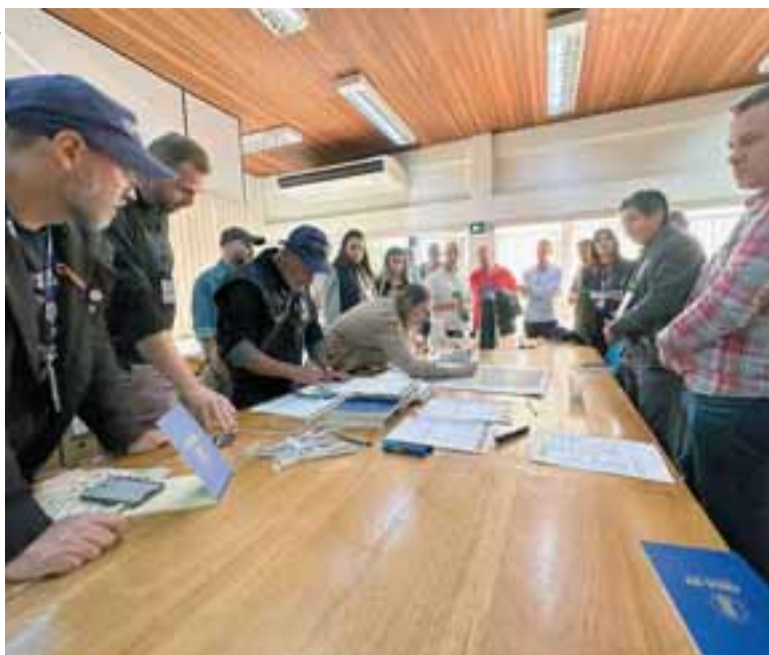
Grupo de profissionais realizou o trabalho no município durante o fim de semana