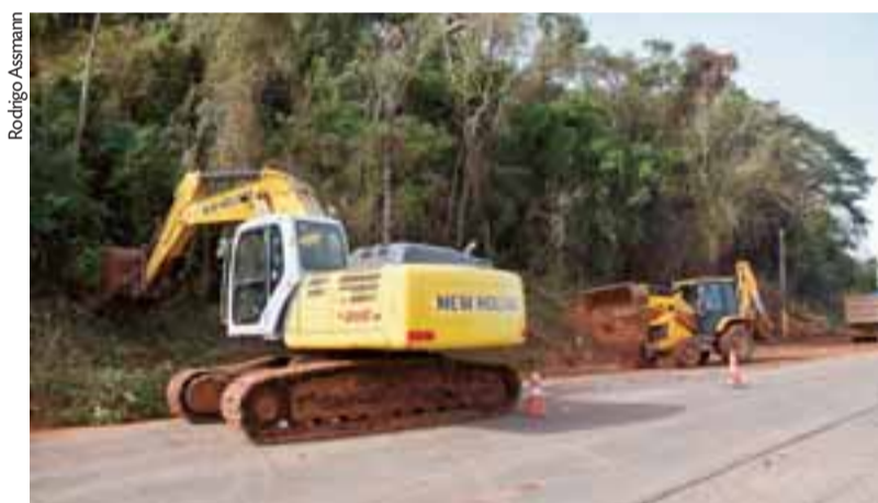
Na BR-471, 12 cargas foram retiradas. Material seguiu para locais perto do autódromo