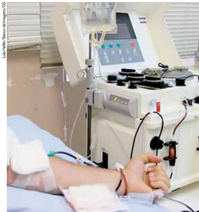
Procedimentos feitos no Hemoviada de Santa Cruz foram prejudicados pela enchente

Para manter o estoque do banco no município, o Hemoviada re-