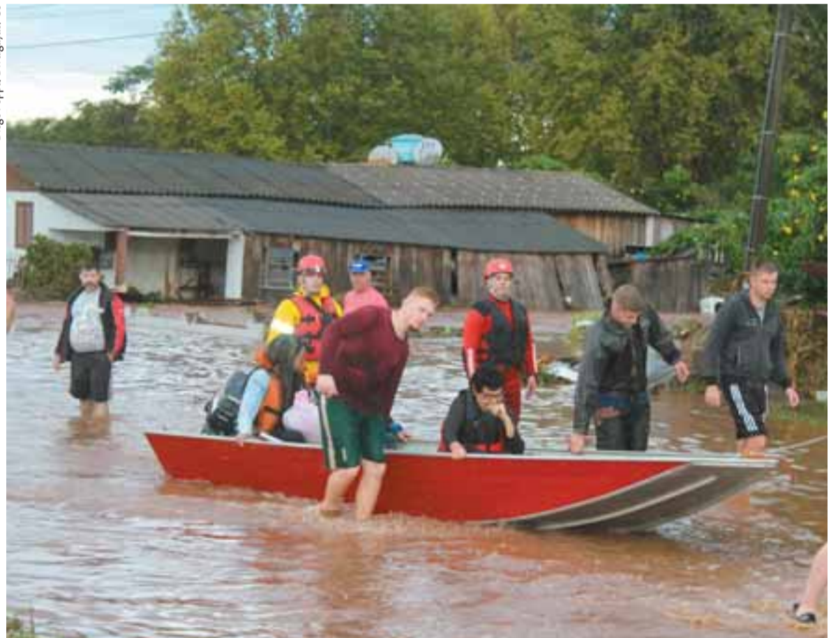
Equipes da Prefeitura e voluntários auxiliaram na retirada dos moradores ilhados. Atingidos estão abrigados no ginásio de esportes

Vídeos que circulam pelas redes sociais mostram a força da água pelas ruas do Centro. Nelas, moradores e comerciantes tentam desesperadamente salvar móveis, eletrodomésticos e equipamentos de serem levados pela correnteza. Outra imagem mostra o momento em que uma ponte é levada pelo rio, na estrada que liga o município a Candelária pelo interior. De acordo com Elesbão, pelo menos dez pontes ficaram total ou parcialmente destruídas.