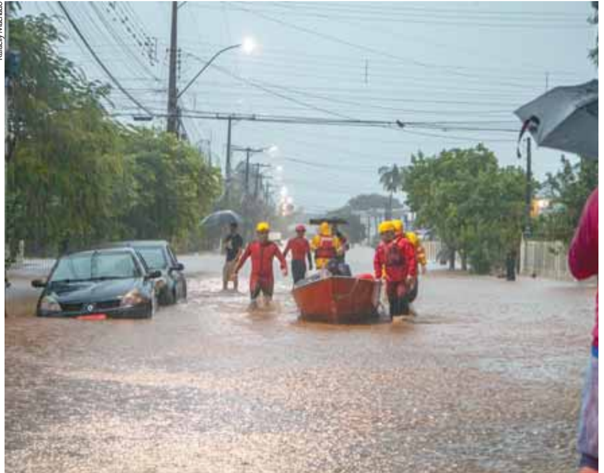
Forças de segurança, como o Corpo de Bombeiros, tiveram que utilizar barcos para resgatar os moradores no Bairro Várzea

Na região da Rodoviária, alagamentos também foram registrados, inclusive com os pátios da Viação União Santa Cruz e da Sinimbu inundados. As empresas deslocaram os ônibus e estacionaram no outro lado da BR-