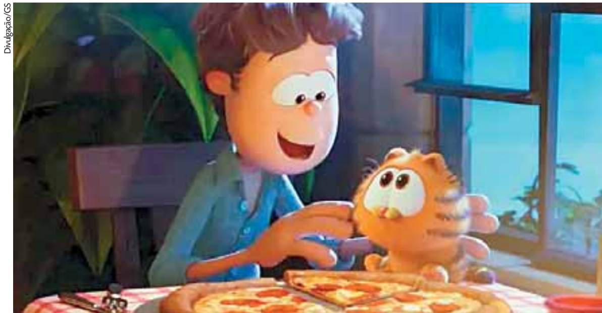
Garfield e seu tutor, Jon Arbuckle, estão em nova animação que estreia hoje, e na qual o gato e o cão Odie se verão em apuros