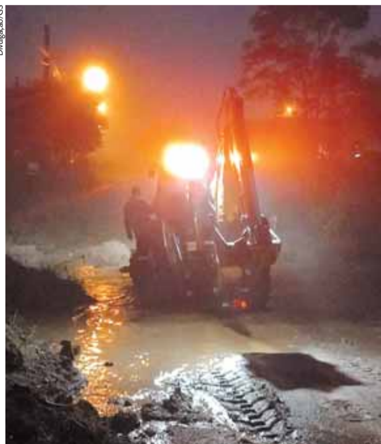
Chuvas intensas dos últimos dias provocaram estragos em vários lugares do município