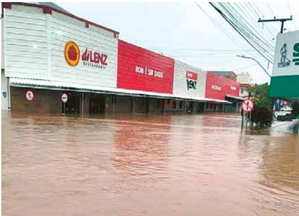
Ruas do Centro foram tomadas pela água. Defesa Civil pediu ontem que moradores das regiões baixas fiquem atentos aos alertas