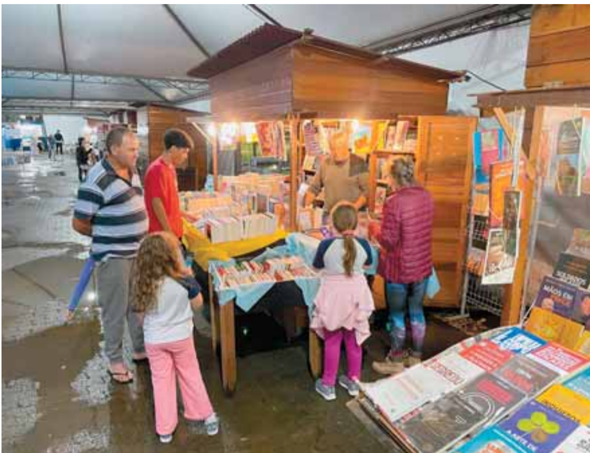
Chuva amenizou um pouco por volta das 18 horas, e essa foi a primeira ocasião no dia em que alguns clientes circularam pela praça