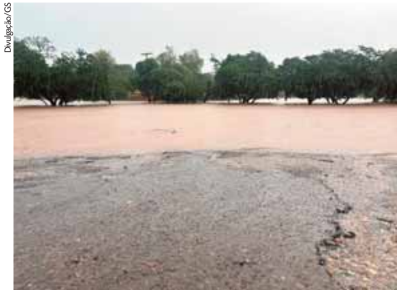
Praia dos Ingazeiros ficou completamente alagada depois da chuva intensa de ontem

O decreto de emergência autoriza, entre outras medidas, a mobilização dos órgãos municipais para atuarem sob a coordenação da Defesa Civil municipal nas ações em resposta ao temporal. Também permite convocar voluntários e realizar campanhas de arrecadação de recursos junto à comunidade para dar assistência à população afetada pelo desastre.