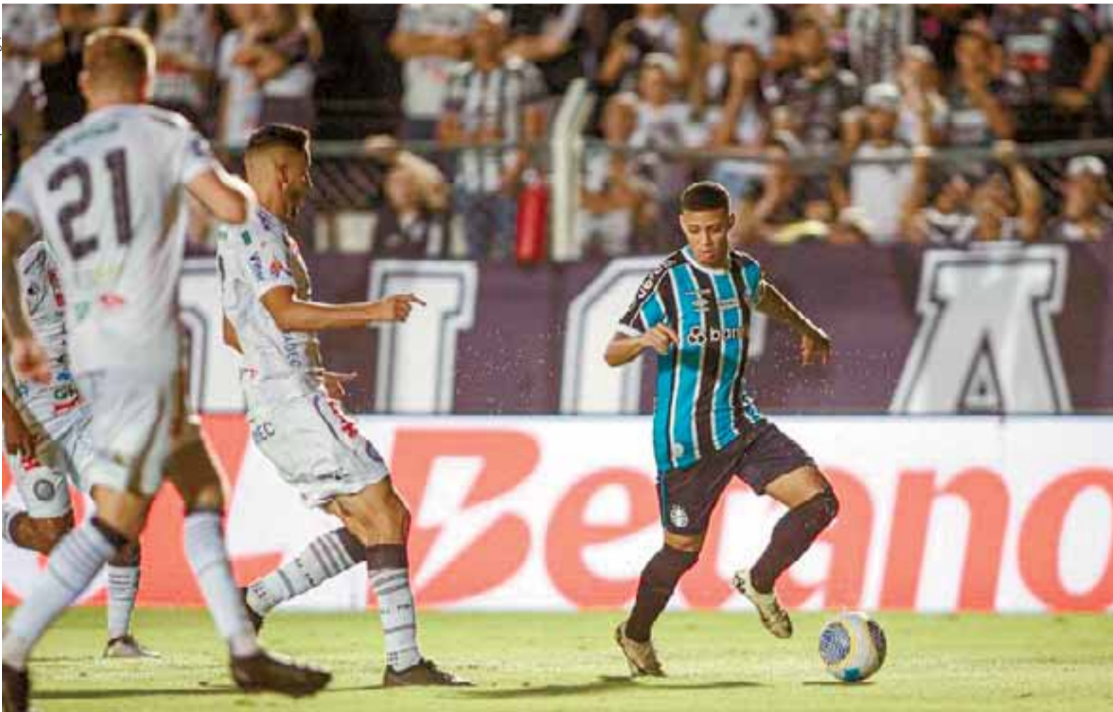
Grêmio não aproveitou as chances, ficou no 0 a 0 com o Operário e precisará vencer no duelo de volta da terceira fase da Copa do Brasil, no dia 22. Página 18