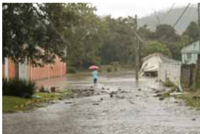
Famílias que precisaram deixar suas casas foram levadas para abrigos

As aulas foram suspensas no município. Os atendimentos em saúde permaneceram no horário de funcionamento no Posto de Saúde Central e na ESF do Bairro Copetti, únicos em condições de atender a população. Atendimentos de urgência, pelo SUS, deverão ser encaminhados ao Hospital Regional Cristo Acolhedor. O comércio também ficou fechado. Foram mantidas as atividades apenas em serviços essenciais, como mercados e farmácias.