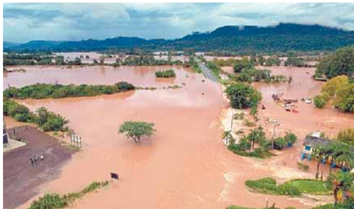
Rio Pardo transbordou e a água tomou conta da área de várzea em Candelária. Residências e empresas ainda calculam os prejuízos

Segundo ele, os barcos que estavam ajudando no resgate não conseguiam chegar aos lugares atingidos devido à forte correnteza. “A situação é delicada, já não se considera mais os prejuízos materiais. A preocupação é com as famílias”, declarou.