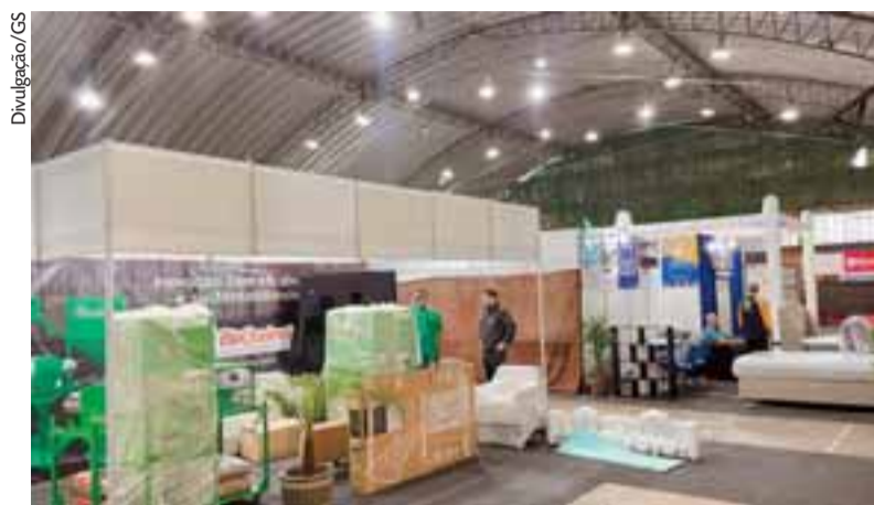
Com o novo calendário, expositores da Fenachim terão mais tempo para a organização

Diante desse cenário, a comissão organizadora da Expocande decidiu transferir a abertura oficial para esta quinta-feira. Além disso, com as circunstâncias de estragos e transtornos, decidiu-se que durante toda a feira não haverá cobrança de ingressos nem de estacionamento. Fi-