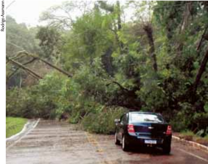
Acesso Grasel bloqueado ontem: liberação da via depende das condições climáticas

Situação mais crítica ocorre no Bairro Várzea. Outros pontos da cidade registraram deslizamentos e alagamentos