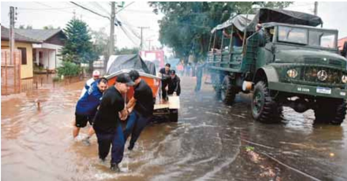
Equipes do Exército, Corpo de Bombeiros e Voluntários ajudaram a remover as famílias que tiveram suas casas alagadas no Bairro Várezza