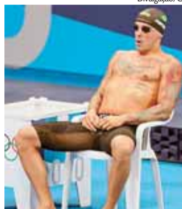
Fratus teve lesões e passou por cirurgias

“É uma decisão muito difícil, mas preciso recuperar meu corpo e minha mente. Ficar fora dos Jogos de Paris é um golpe duro. Foram períodos longos de recuperação, meses de dores, limitação de movimentos, e isso tudo impactou demais no planejamento”, comentou.