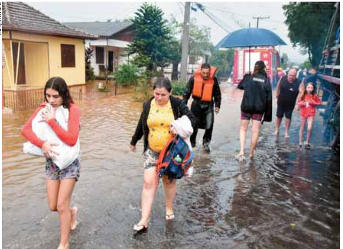
Alertas sobre o aumento dos volumes de chuva podem levar mais famílias a terem que deixar suas casas nas áreas de maior risco

Já o ar frio vindo da Argentina avança sobre o Estado e será mais sentido na sexta, com amanhecer de mínimas baixas na Campanha e no Sul, e máximas menores à tarde. O contraste térmico e o avanço da frente fria na quinta reforçam a instabilidade com chuva forte, sobretudo na Metade Norte, onde estão as nascentes dos rios que cortam os vales e já saem do leito. Diante disso, a recomendação é que os moradores busquem se manter em locais seguros e evitem sair de casa só para ver as enchentes.