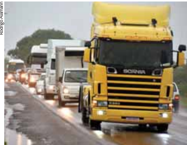
No Vale do Rio Pardo, trânsito foi interrompido em pontos da RSC-287

As informações são do Departamento Autônomo de Estradas de Rodagem (Daer), consolidadas com o Comando Rodoviário da Brigada Militar (CRBM). A Secretaria de Logística e Transportes trabalha para desobstruir as vias o mais rápido possível, de modo a garantir o tráfego.