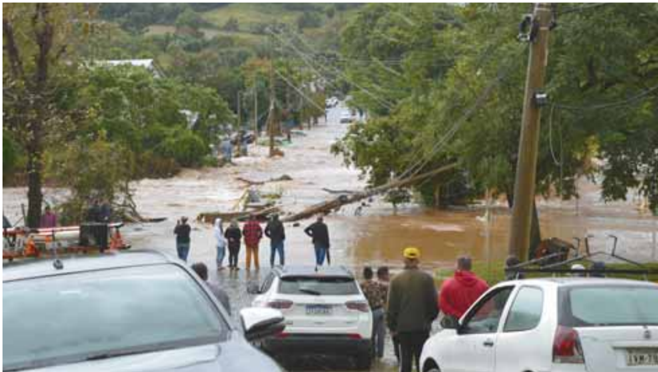
Correnteza arrancou postes e árvores e cobriu ruas em diversos pontos de Sobradinho. Prefeito confirmou o decreto de situação de emergência