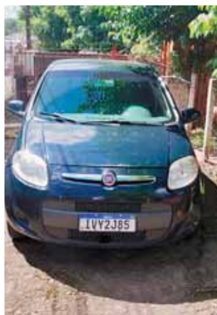
Quem tiver informação do carro deve acionar a polícia militar ou a civil pelos telefones 190 e 197