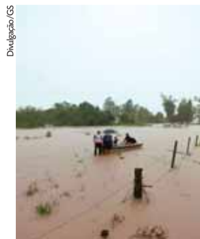
Município teve diversos pontos isolados