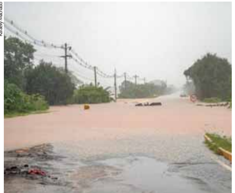
Trecho da ERS-409 nas proximidades do Lago Prefeito Telmo Kirst ficou bloqueado

O prefeito fez um alerta à população para que fique atenta quanto ao risco de elevação no nível dos rios pela água que ainda virá das partes mais altas, como Sinimbu e Candelária. Afirma que a enchente é histórica e não tem conhecimento de situação semelhante no município.