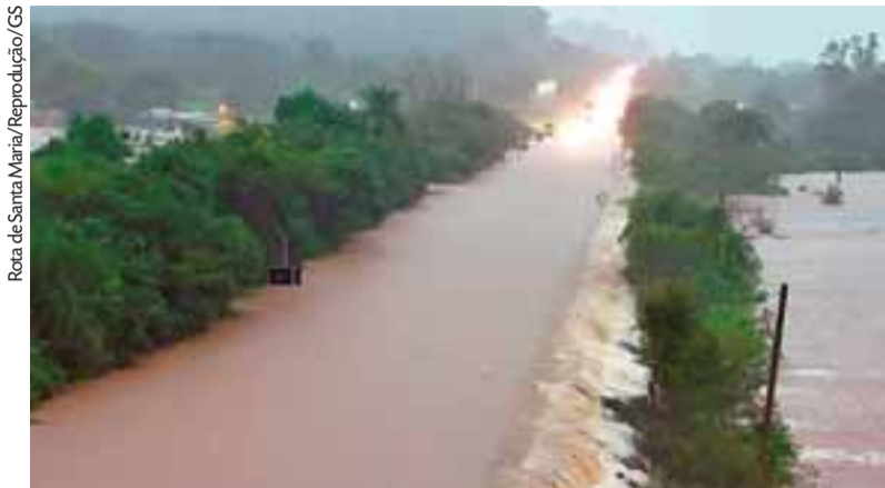
Em Candelária, trecho da RSC-287 foi encoberto pela água e trânsito foi bloqueado