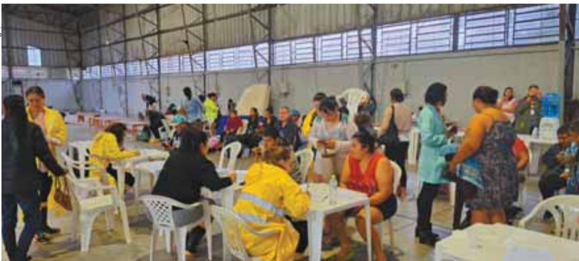
Servidores da Prefeitura cadastraram e prestaram suporte às pessoas que precisaram de atendimento nos pavilhões do Parque da Oktoberfest