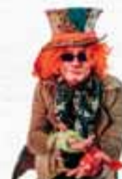
DJ CHAPELEIRO MALUCO