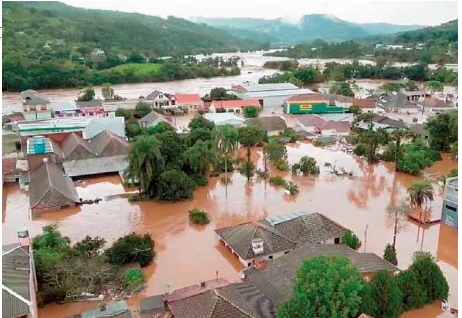
Imagens de moradores mostram que centro da cidade ficou submerso durante toda a terça-feira. Ponte que liga essa região à localidade de Rio Pequeno foi levada pela correnteza