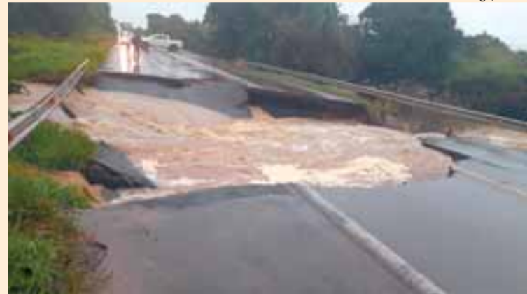
Passagem de veículos foi interrompida depois que parte da BR-290 cedeu ontem