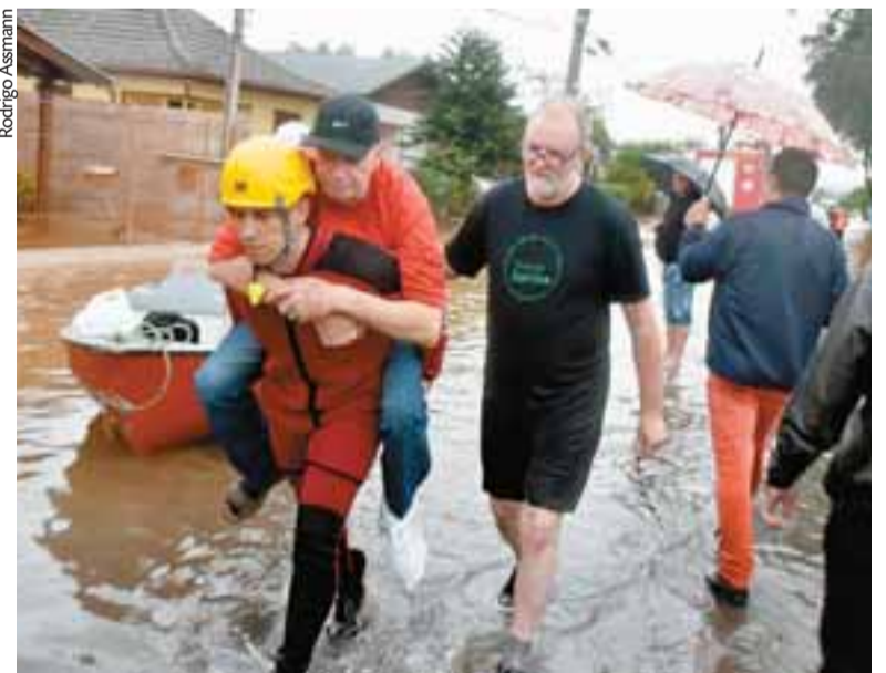
Bairro Várzea e região de Rio Pardo foram os lugares mais atendidos pelas equipes

As oito casinhas típicas do Parque da Oktoberfest também estão sendo utilizadas para o acolhimento das pessoas, em especial o público idoso e as crianças. Estruturas para recreação