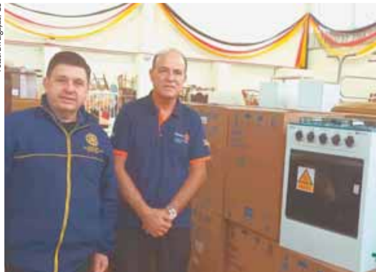
Rotary repassou fogões a famílias que perderam móveis e eletrodomésticos na cheia