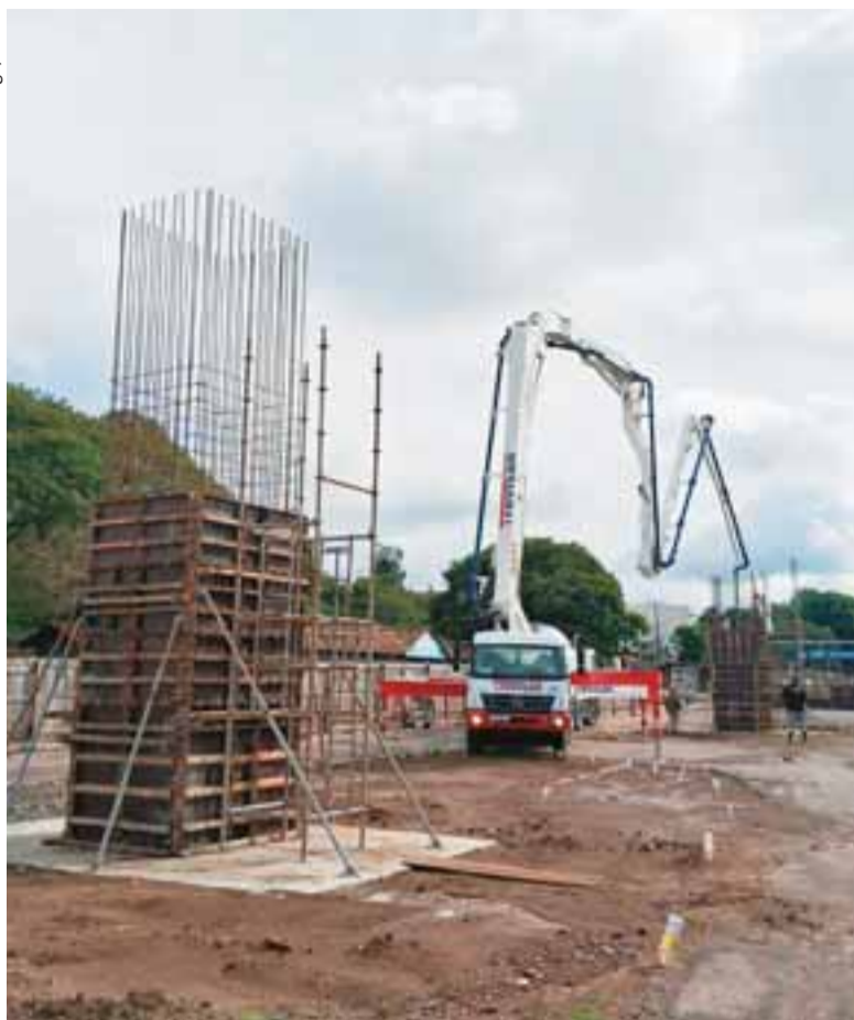
Equipes trabalham para a concretagem dos pilares que vão sustentar a estrutura