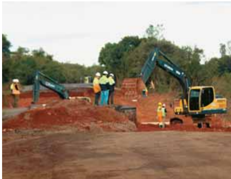
Concessionária atua na construção de uma estrada paralela à 287, em Vila Mariante

Mais adiante, outro grande problema é a ponte que cedeu totalmente com a força das águas do Arroio Grande, em Santa Maria. Ali é feito o trabalho de recomposição das cabeceiras. Para permitir o fluxo de veículos até o fim da próxima semana, uma ponte do exército será instalada. A estrutura vai operar em apenas um sentido, com o sistema pare e siga e sem limitação de carga. Uma nova ponte será construída ao lado da estrutura provisória.