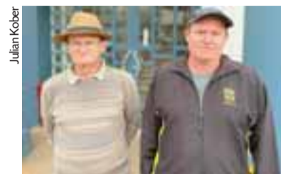
Back e Staub: situação já é preocupante

A alternativa evitou que eles tivessem prejuízo na produção. No entanto, a rotina tem afetado as famílias, que possuem crianças, idosos e pessoas com deficiência. “Quando anoitece, ficamos no escuro total”, afirmou