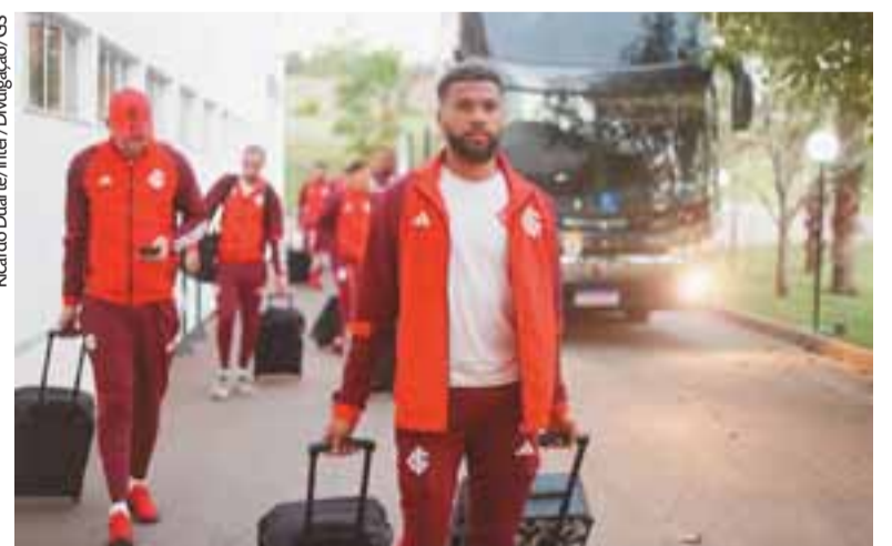
Grupo colorado desembarcou na cidade nessa segunda-feira e inicia as atividades hoje

Para a sequência da temporada, o Colorado também divulgou ontem, no mesmo comunicado,