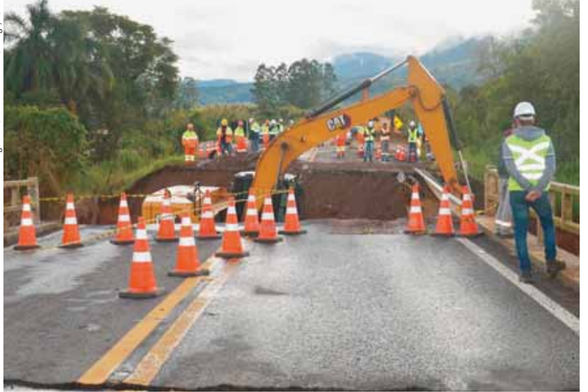
Equipes da Rota de Santa Maria deram início aos trabalhos na ponte ontem. Esse serviço deve se estender pelas próximas semanas

Para liberar a circulação de veículos na via, teve início ontem o serviço de recomposição da cabeceira da ponte. “Um vão será demolido de forma controlada, após se avança com a cabeceira até a estrutura íntegra da ponte, com o uso de pedras para dentro do rio. Com isso, poderemos liberar o trânsito até a primeira se-