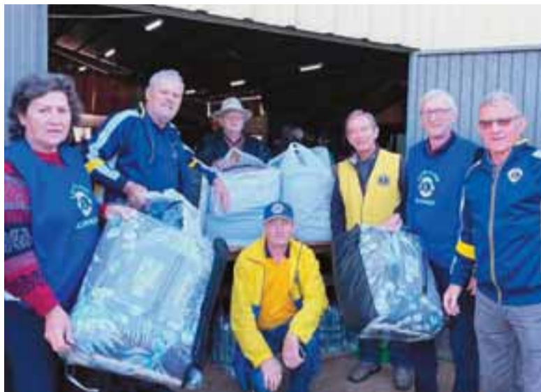
Lions fez a entrega de cobertores, itens essenciais para esse período de frio no Estado

Até o último sábado, a chave Pix do Lions Clube Santa Cruz do Sul Aliança havia recebido R$ 92.320,84 e o repasse de doações