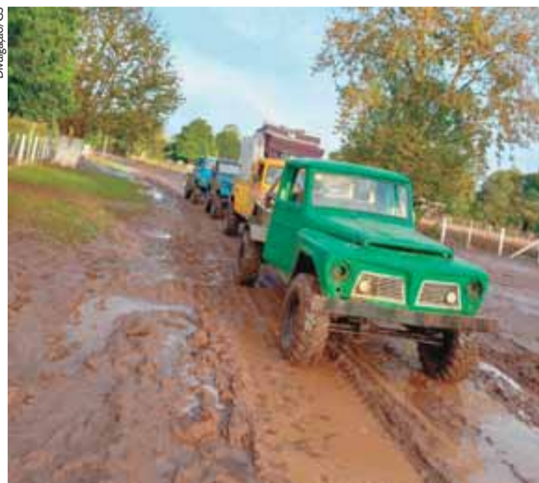
Alguns lugares são acessíveis somente por veículos que têm tração nas quatro rodas

Durante o percurso, os voluntários puderam testemunhar o estrago provocado no interior de Candelária. “É cena de filme”, descreveu Hiltz. Segundo ele, muitos moradores estão sem ânimo de voltar e querem ir embora. “Tem alguns que construíram ca-