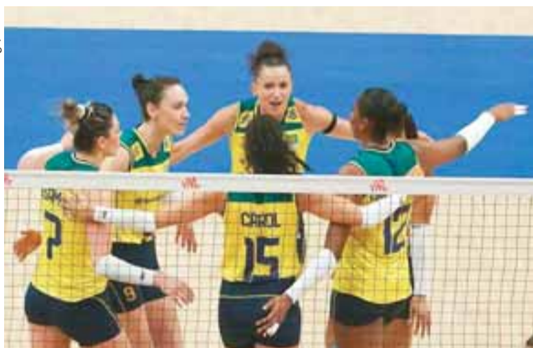
Time não tomou conhecimento da Sérvia e fez 3 sets a 0 ontem, no Maracanãzinho

Com a Sérvia “engasgada”, o Brasil começou de forma arrasadora e não se importou de enfrentar uma equipe alternativa da adversária, que preservou suas principais estrelas para os Jogos Olímpicos de Paris. O primeiro set foi um passeio da Sele-