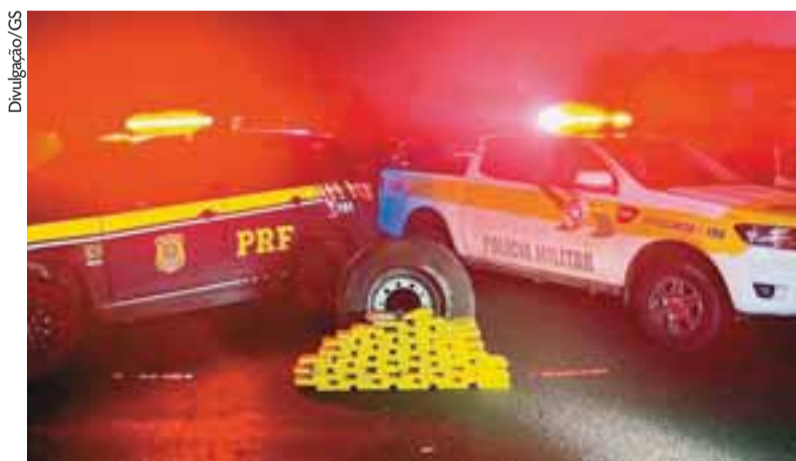
Agentes encontraram os 52 quilos de drogas escondidos no estepe do caminhão

A carreta, com placas de Cascavel, transportava aproximadamente 20 toneladas de donativos, arrecadados de forma correta pela Defesa Civil, no Paraná. O veículo trafegava com credencial de ajuda humanitária expedida pela Defesa Civil, e um adesivo