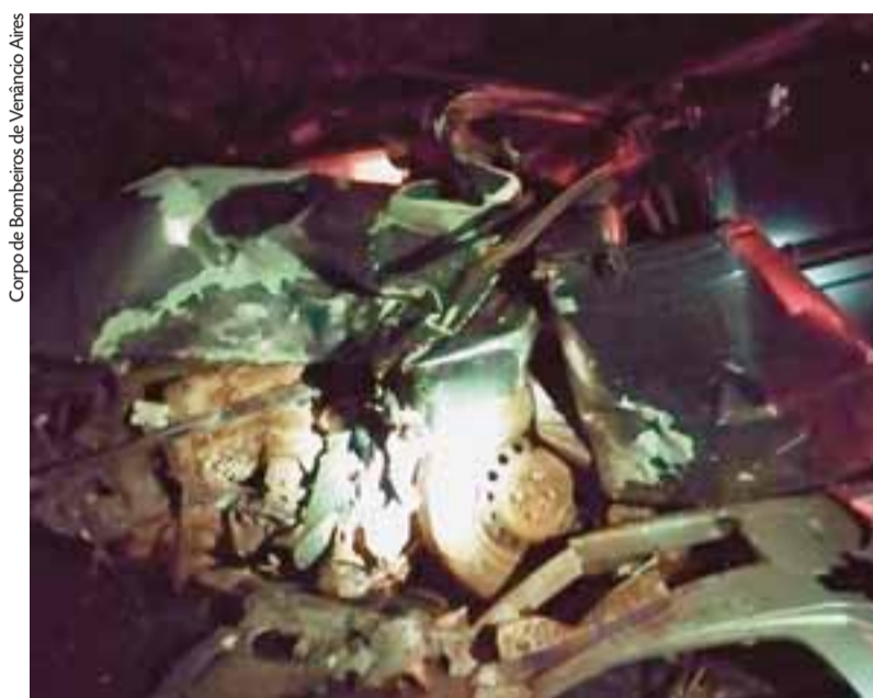
Acidente entre os dois veículos aconteceu por volta das 5 horas da manhã de ontem

O motorista do outro veículo envolvido foi atendido por equipes do Serviço de Atendimento Médico de Urgência (Samu) e transportado para a rede hospitalar de Venâncio Aires. As circunstâncias do acidente ainda se-