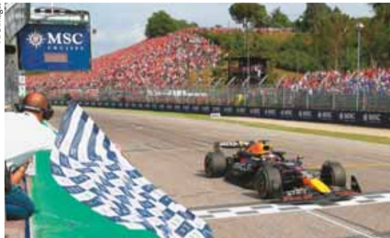
Mais uma vez, Verstappen se mostrou seguro para cruzar a linha de chegada em primeiro

Os pilotos retornarão às pistas nos dias 24 a 26 deste mês, para o Grande Prêmio de Mônaco.