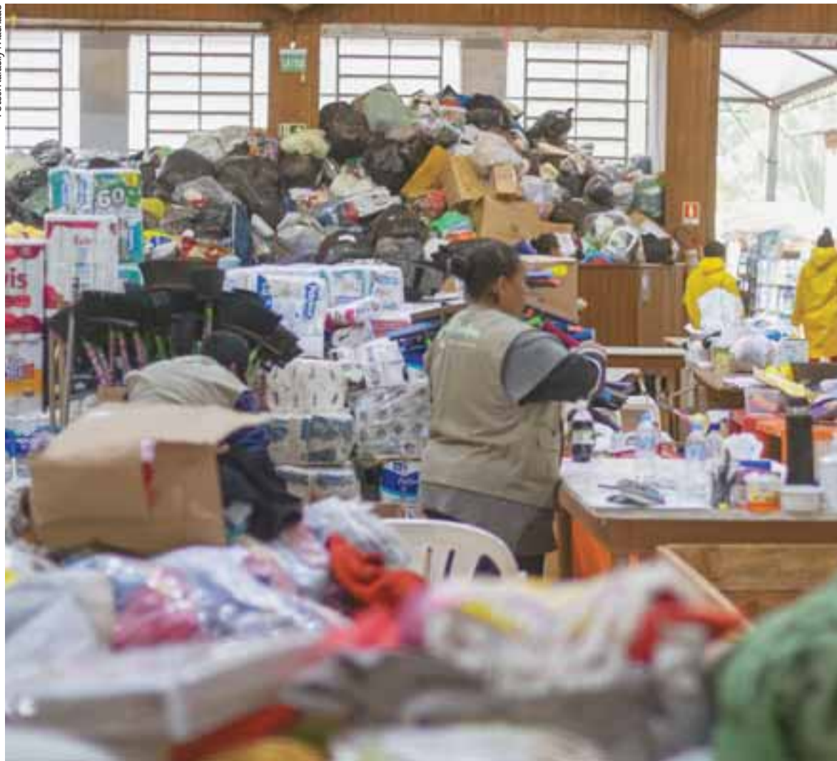
Rede de acolhimento precisa de mais voluntários para a triagem e a entrega. Muitos saíram porque tiveram que retomar as atividades