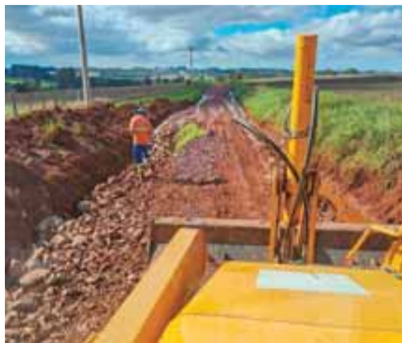
Um dos focos das equipes é garantir a desobstrução de estradas

nicipio fornecerá insumos essenciais para o cultivo, como mudas de alface, beterraba, repolho, brócolis e tempero-verde.”