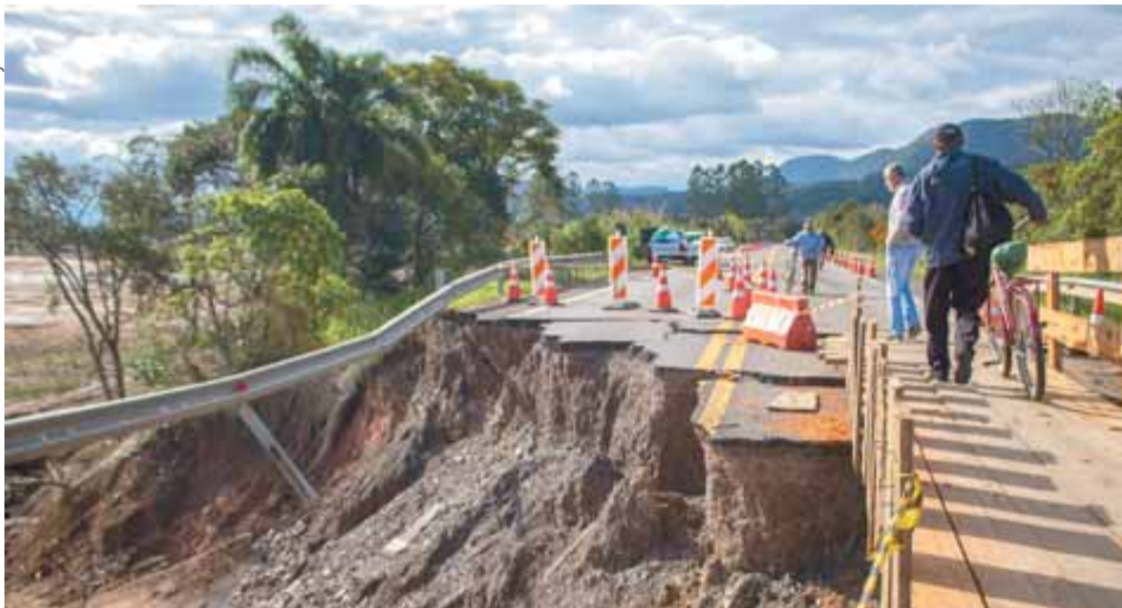
Pinguela improvisada, que havia sido montada sobre o que sobrou da ponte, era utilizada até esse domingo pelos moradores e demais usuários