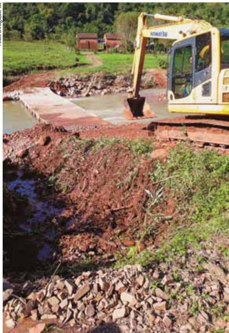
Trabalho nas localidades tem a colaboração das seis subprefeituras de Santa Cruz