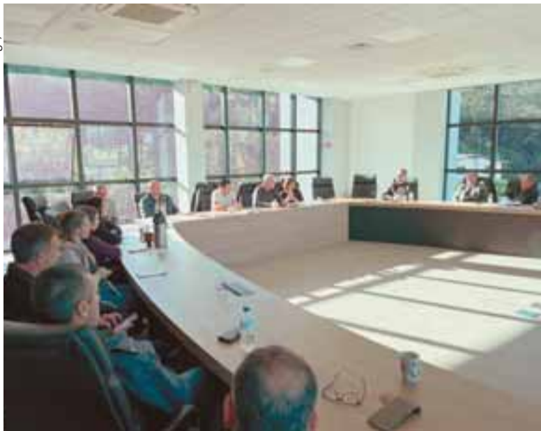
Reunião com as entidades envolvidas foi realizada na sede da Sicredi Vale do Rio Pardo