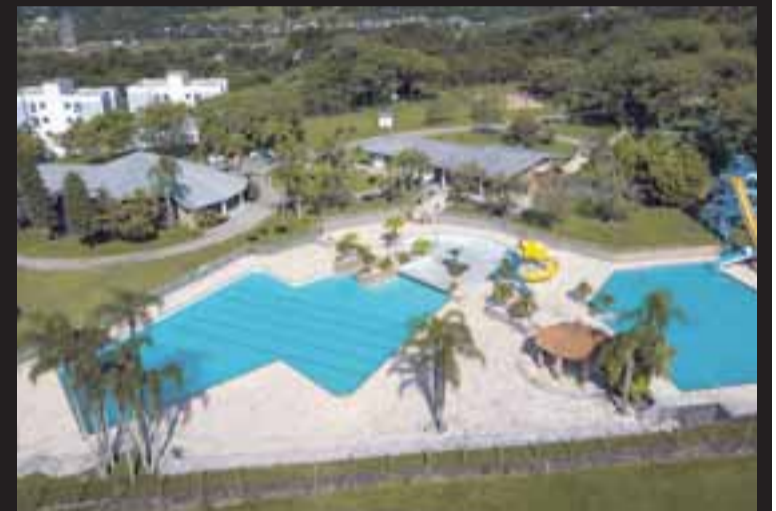
Complexo de piscinas do Clube Aliança está pronto para receber seus associados