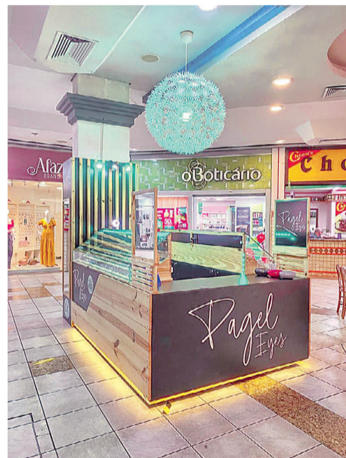
Espaço Pagel Eyes no Shopping Santa Cruz

A dedicação da equipe e o histórico da marca fazem com, que além de belos e variados modelos, a Pagel Eyes, que atende no Shopping Santa Cruz, venda proteção e qualidade aos olhos, estilo e conceito. Assim, ela traz motivos para elevar a autoestima e as pessoas curtirem momentos especiais, com personalidade, com os modelos que mais se encaixam com o formato do rosto.