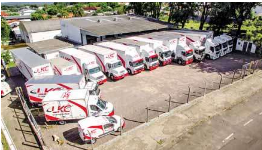
Primeira sede própria da LKC, na São José, ficou pequena para o tamanho da estrutura e o desenvolvimento da empresa