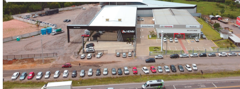
Novo prédio, com uma área de 5 mil metros quadrados, está localizado na RSC-287

completa de peças e serviços com qualidade e vamos buscar expandir para os mercados de Venâncio Aires e do Vale do Taquari”, ressaltou.